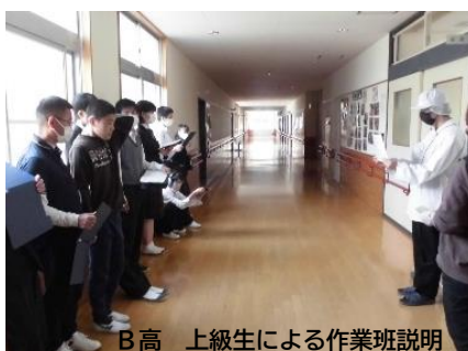
B高 上級生による作業班説明